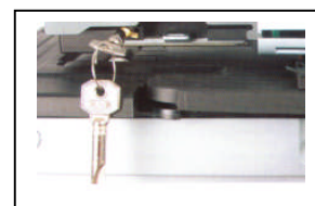
Serrure de sécurité pour se prémunir d'un usage abusif de la plaque de texte