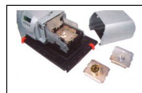
Egalement disponible en version 880-50. Cet appareil travaille avec des têtes de marquage et non avec des plaques de texte.