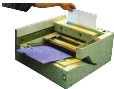
Mettre les feuilles dans le chariot